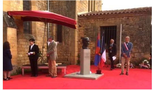
Le moment fort de l'inauguration : Me la Secrétaire Générale de l'ambassade d'Arménie avec à ses côtés Me la Sous Préfète dévoile le buste de l'Amiral Dartige du Fournet

Une cérémonie très émouvante d'inauguration du buste a démarré le dimanche matin par cinq discours, certains très engagés sur le génocide arménien et la situation actuelle au Haut-Karabagh à la suite de la guerre entre l'Arménie et l'Azerbaïdjan.