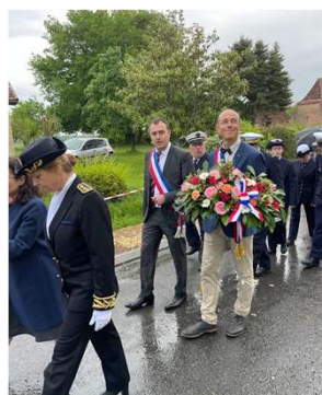
Le départ pour la cérémonie sur la tombe de l'Amiral Dartige du Fournet.