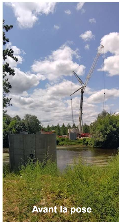
Avant la pose

Le franchissement de la Vézère est nécessaire à la sortie sud du Bugue en raison de la contrainte topographique du lieu (falaise, voie ferrée, route départementale et rivière). Une passerelle est donc implantée au lieu-dit "Les Courrèges". Elle ne sera rendue accessible qu'aux piétons et véhicules non motorisés. Les travaux de voirie et d'aménagement ont été engagés en avril 2022. Ils seront terminés courant 2023. Quant à la passerelle, elle sera finalisée au cours de l'automne 2023.